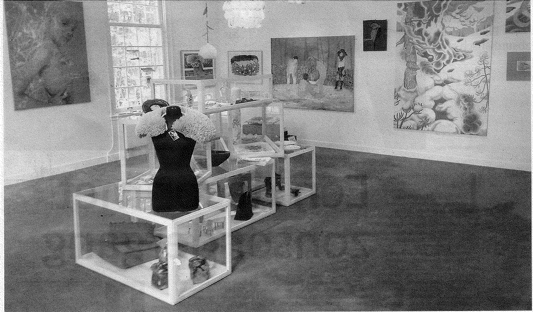
Jonge kunstenaars reageren op het thema natuur.